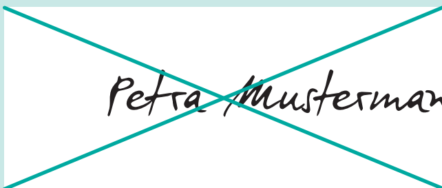
Falsch: Unterschrift nicht innerhalb des Feldes