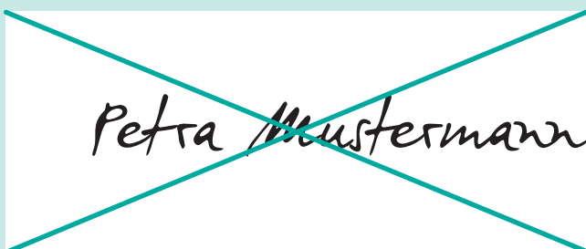
Falsch: Unterschrift rechtsbündig